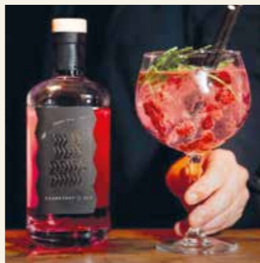
DÉ VLIELANDSE GIN!